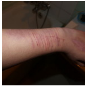
By Degagebouche (Own work) [ CC BY-SA 3.0 ], via Wikimedia Commons